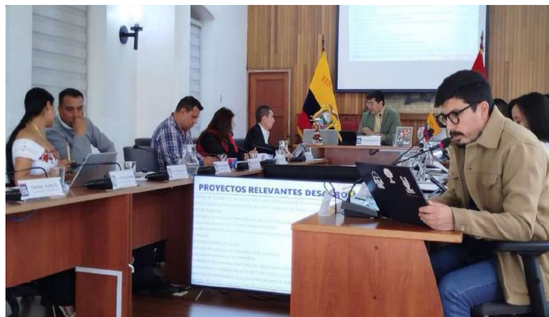
• Concejo de Riobamba vuelve a rechazar el presupuesto municipal por segundo año consecutivo.

En la sesión extraordinaria el presupuesto para el ejercicio fiscal 2026 no alcanzó la mayoría absoluta requerida. Los ediles coincidieron en observaciones de fondo, información incompleta, incongruencias con la estructura orgánica municipal y una planificación que no conecta con los problemas cotidianos de los riobambeños.