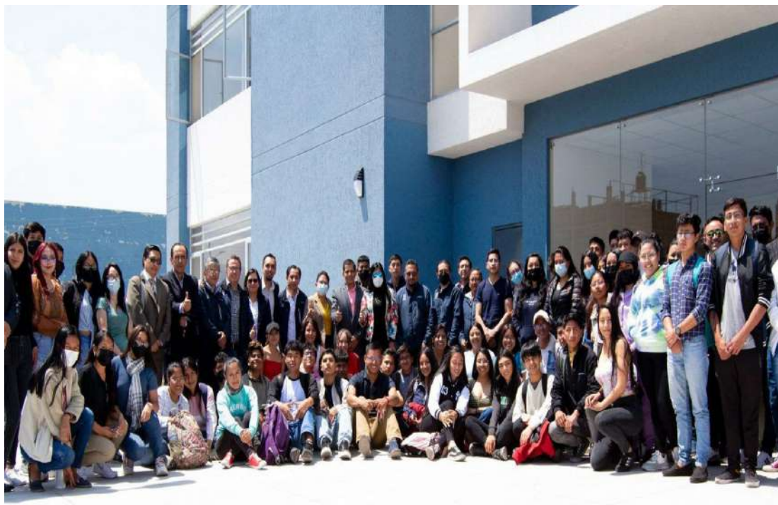
• La Espoch amplía su oferta académica con tres nuevas carreras aprobadas por el CES.

EDUCACIÓN. La Escuela Superior Politécnica de Chimborazo (Espoch), mediante la Facultad de Administración de Empresas (FADE), anunció oficialmente la apertura de tres nuevas carreras aprobadas por el Consejo de Educación Superior (CES). Se trata de Derecho, Gestión de Inteligencia de Negocios y Economía y Comercio, programas diseñados bajo enfoques formativos actuales y alineados con las demandas educativas, productivas y sociales del país.