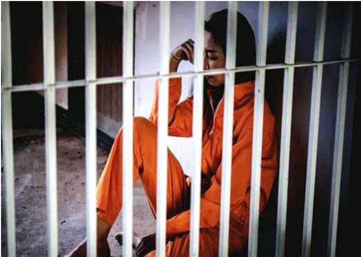
La procesada fue sentenciada a 13 años de prisión por el homicidio de su pareja.