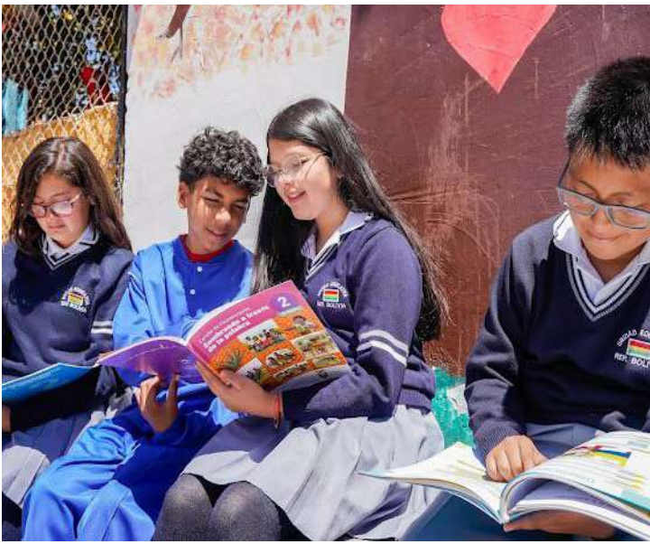
● Largas vacaciones para estudiantes por navidad y año nuevo.

VACACIONES. El Ministerio de Educación, Deporte y Cultura confirmó que el periodo oficial de vacaciones para el sistema educativo se cumplirá del 26 de diciembre de 2025 al 4 de enero de 2026, de acuerdo con los feriados nacionales establecidos por el Gobierno. Las actividades escolares se retomarán el lunes 5 de enero en las instituciones fiscales, mientras que los planteles particulares, fisco-municipales y municipales podrán adecuar su propio calendario, respetando los 200 días obligatorios de clases.