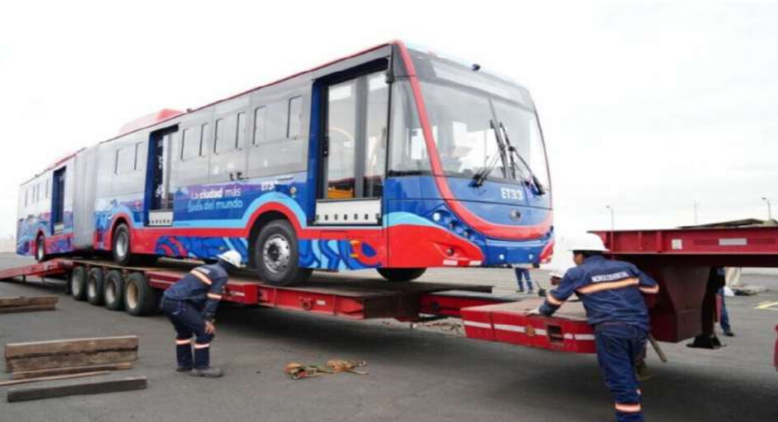
• La Contraloría General del Estado señala que hay responsabilidades civiles y penales en la compra de los trolés de Quito.

Se documentó permitió que el Gerente General de la Epmtpq iniciara la contratación sin respetar los procedimientos previstos en la normativa de compras públicas ni las condiciones del proyecto de inversión. El informe describe que el memorando firmado por el Alcalde habilitó la participación de la Unops y abrió la puerta a un esquema distinto al que exige la inversión pública para la compra de bienes normalizados, como los trolés. Contraloría señala que el proceso avanzó sin subasta inversa, sin la coordinación previa requerida y sin la aplicación del proyecto de inversión aprobado.