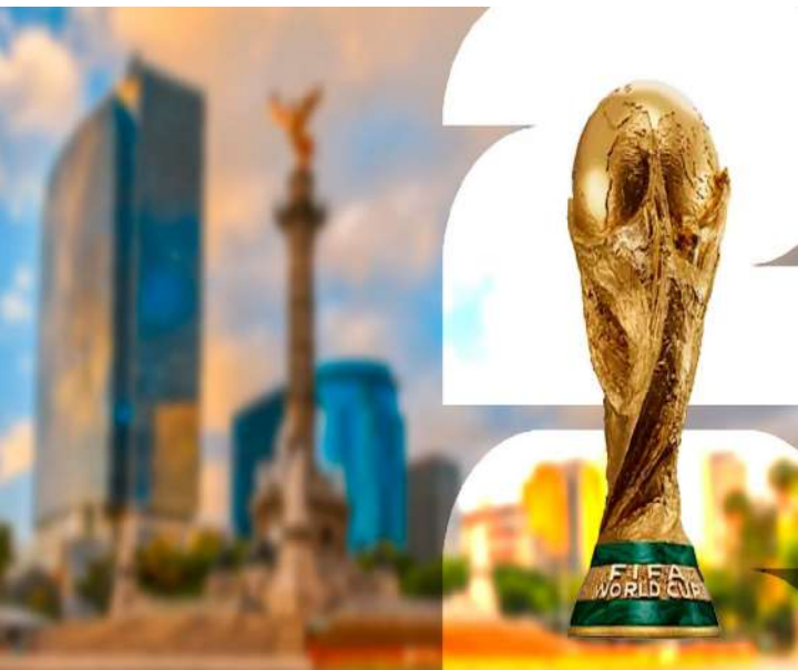
• Precios por los cielos por el Mundial.

COSTOS. Apenas se conoció el calendario completo de la Copa del Mundo, los precios de los hoteles en Estados Unidos, México y Canadá registraron incrementos que, en muchos casos, superan el 300%.