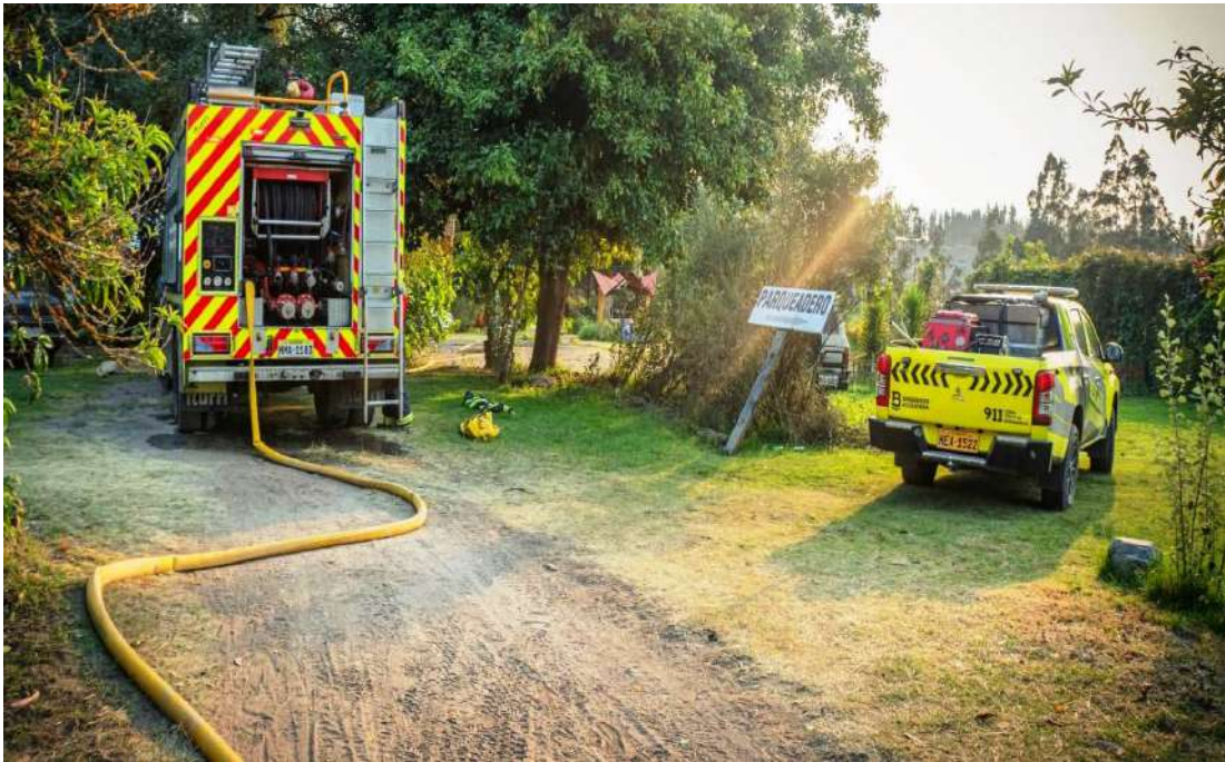
Bomberos controlaron el incendio forestal que amenazaba una vivienda en San Clemente.

siniestro de proporciones mayores. Los bomberos señalaron que el caso de San Clemente se suma a una serie de incendios atendidos en zonas periféricas de la ciudad y en comunidades rurales de Chimborazo. En la última semana, se han registrado intervenciones en sectores como Cubijes, Licán, Yaruquíes y la vía a Guano, muchos de ellos vinculados al uso no autorizado de fuego para limpieza de terrenos. La institución mantiene personal en alerta permanente ante el aumento de emergencias forestales y ha reforzado los patrullajes preventivos en áreas con historial de quemas. (30)